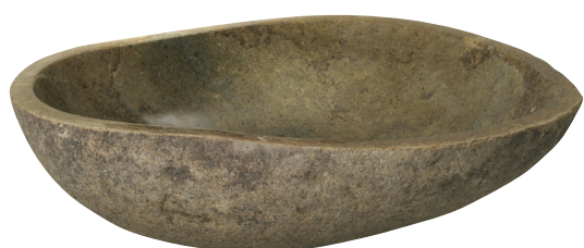
Tailles aléatoires (environ L 50 x P 40 cm) Ref. 6.05.001 AL > 590 € H.T - Eco Part: 0,22€ H.T Si percement/découpe à faire sur le plan de travail - Ref. TP/PP