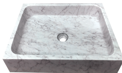
L 50 x P 40 x H 12 cm Ref. 6.05.002 PC > 740 € H.T - Eco Part: 0,18€ H.T Si percement/découpe à faire sur le plan de travail - Ref. TP/PP