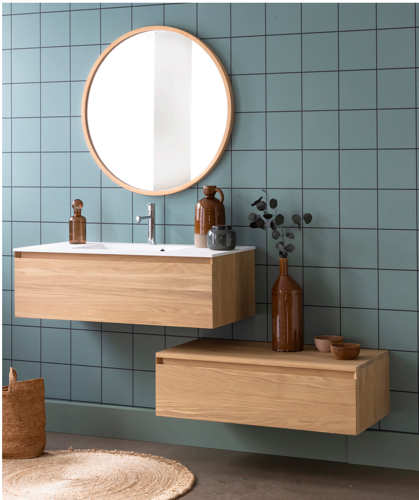
Finition Huilé Naturel