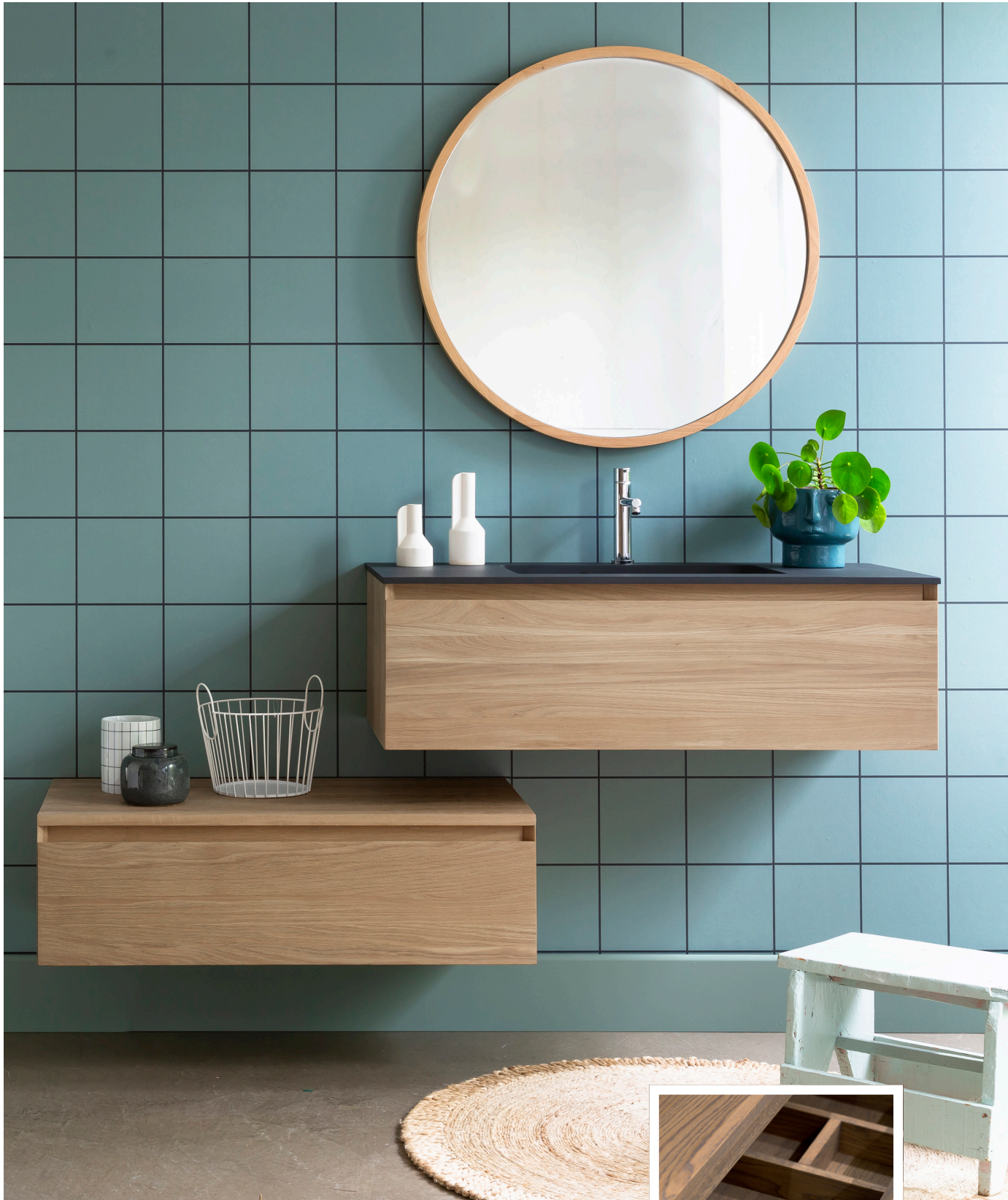
Finition Huilé Naturel