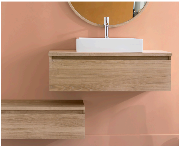
Finition Huilé Naturel